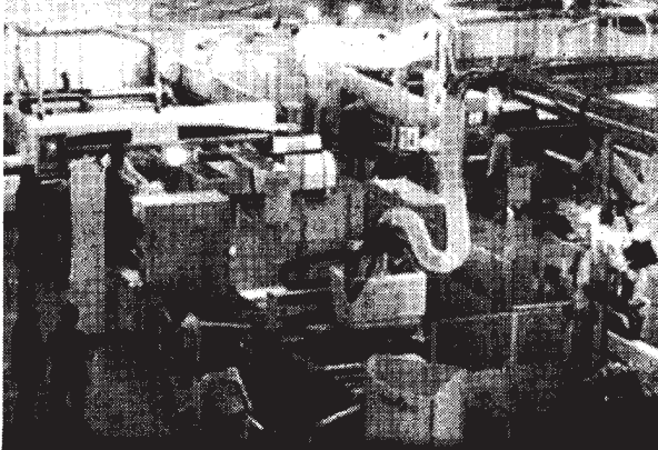
Un'immagine degli stand di Xylexpo, l'esposizione mondiale delle tecnologie del legno in svolgimento alla Fiera di Milano